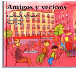
Amigos y vecinos

es.slideshare.net/DocentesDiversidad/amigos-y-vecinos